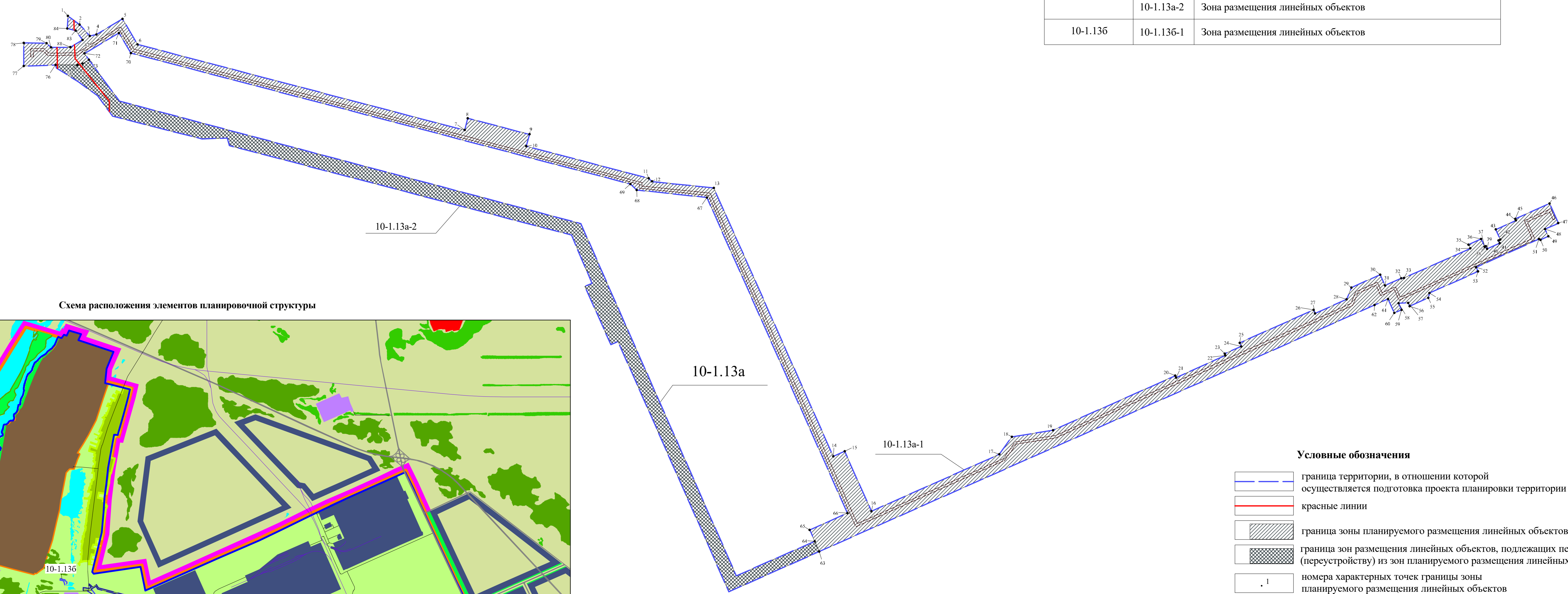
Схема расположения элементов планировочной структуры