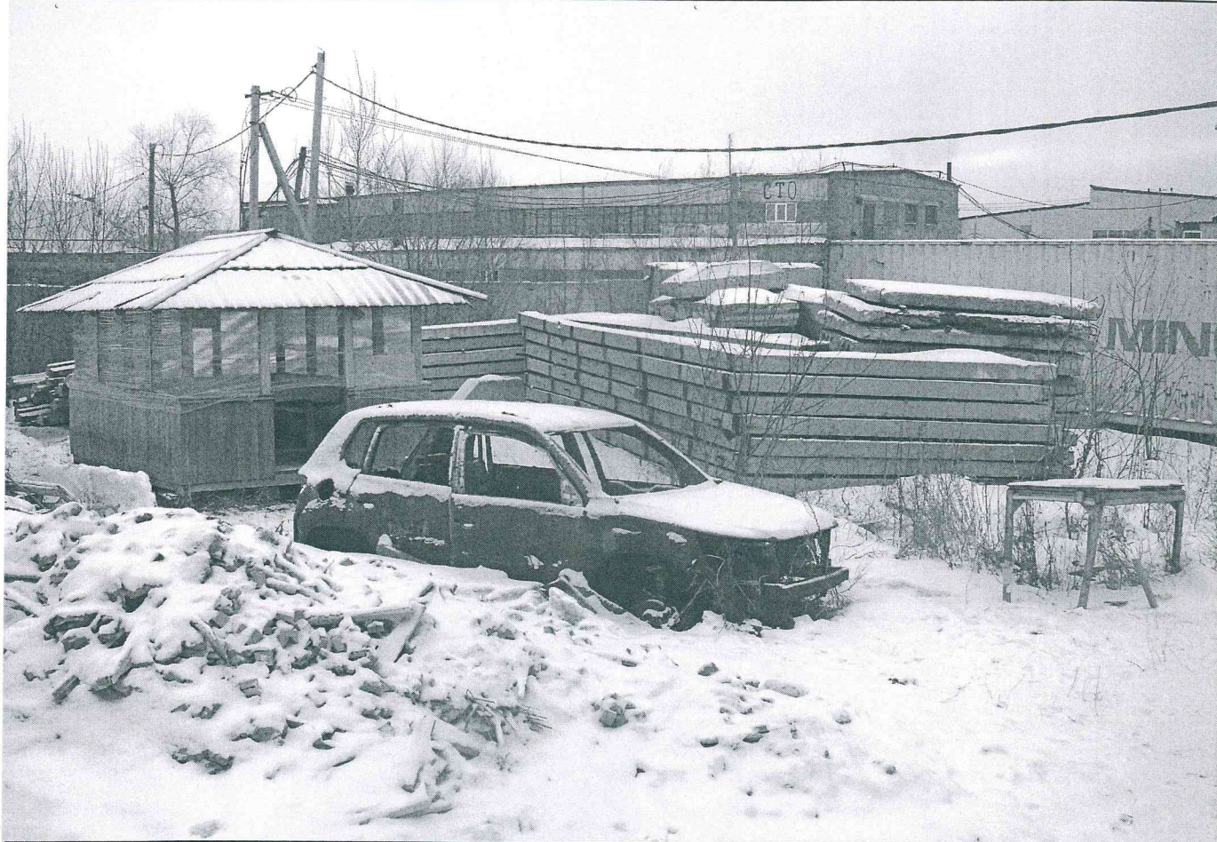
Земельный участок с кадастровым номером 55:36:190201:2069, предоставленный ООО «Ривьера-Менеджмент» по договору аренды № ДГУ/12-2888-К-33 для строительства коммунально-складского объекта 4 – 5 класса опасности (пристройка к существующему зданию мебельного цеха под склад), фактически используемый ООО «Массив Комплект»