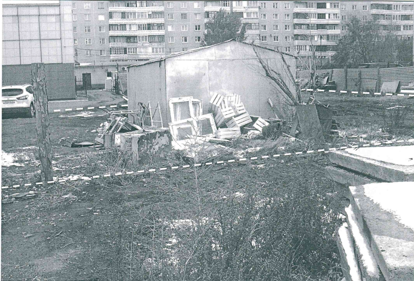
Земельный участок с кадастровым номером 55:36:110225:2089, предоставленный в аренду Воложаниной Ю.В. по договору аренды земельного участка № ДГУ-К-35-1407 для строительства кафе с комплексом дополнительных услуг