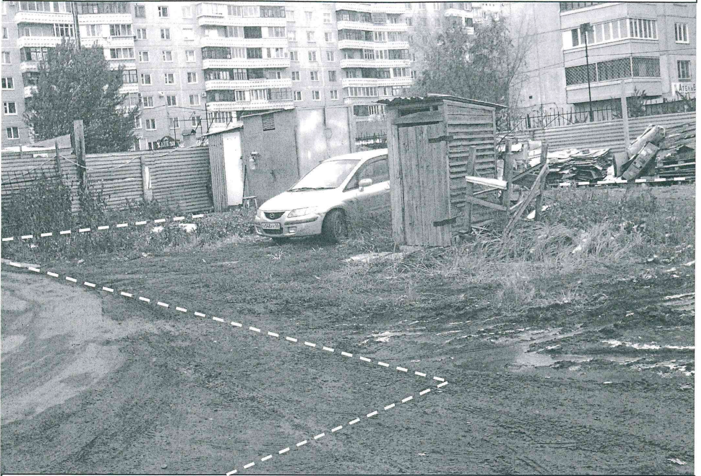
Земельный участок с кадастровым номером 55:36:110225:2089, предоставленный в аренду Воложаниной Ю.В. по договору аренды земельного участка № ДГУ-К-35-1407 для строительства кафе с комплексом дополнительных услуг