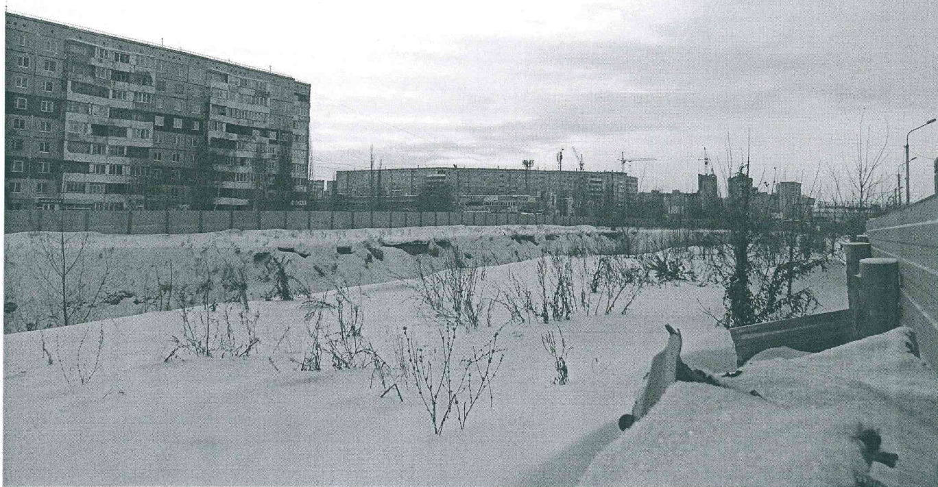
Земельный участок с кадастровым номером 55:36:110101:2093, предоставленный ООО "Коллекторское агенство "Капитал-Инвест" по договору аренды № ДГУ-К-34-745 для строительства подземного гаража-стоянки