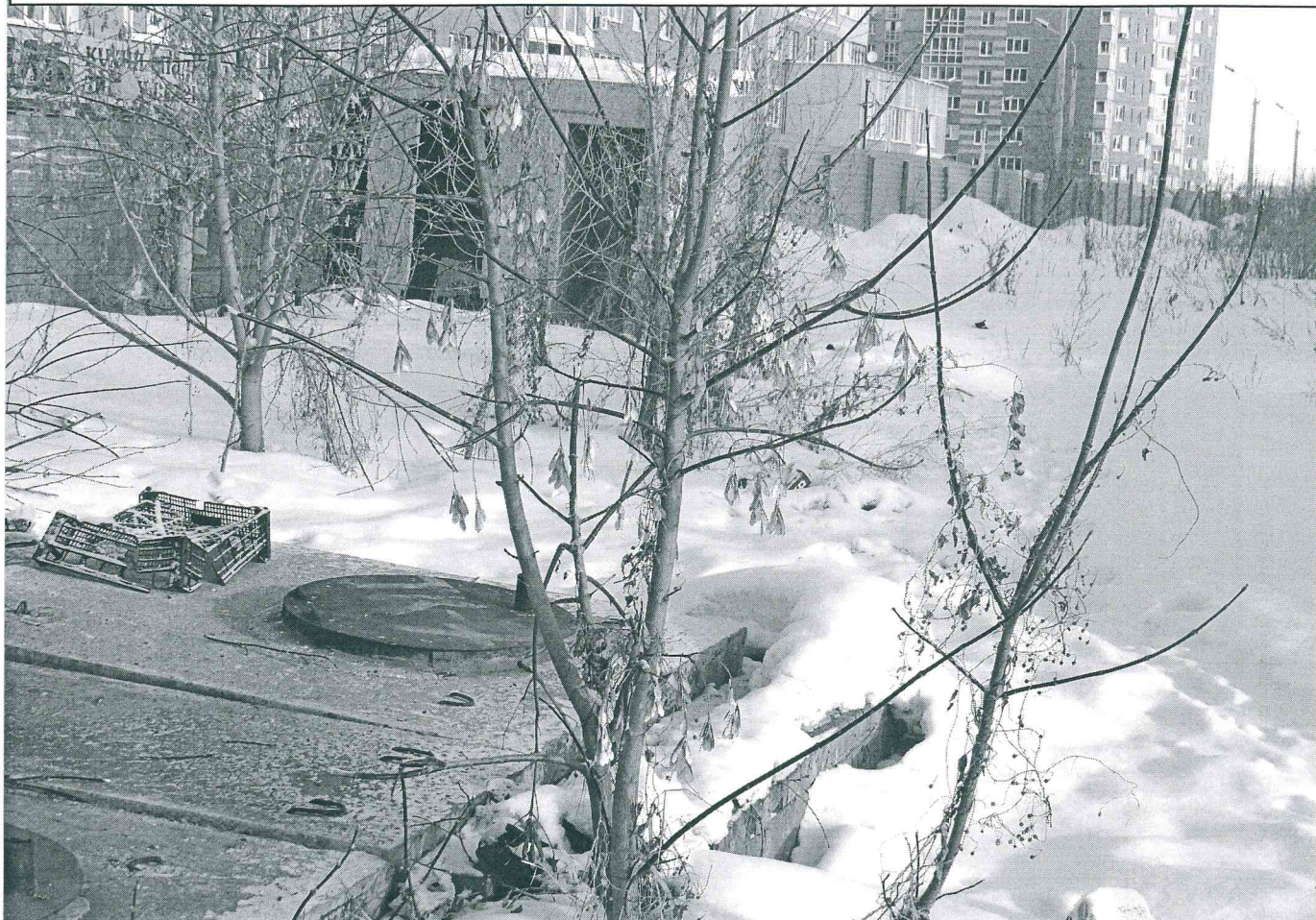
Земельный участок с кадастровым номером 55:36:110101:2093, предоставленный ООО "Коллекторское агенство "Капитал-Инвест" по договору аренды № ДГУ-К-34-745 для строительства подземного гаража-стоянки