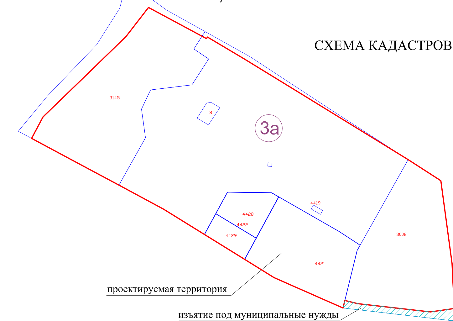
СХЕМА КАДАСТРОВОГО ПЛАНА