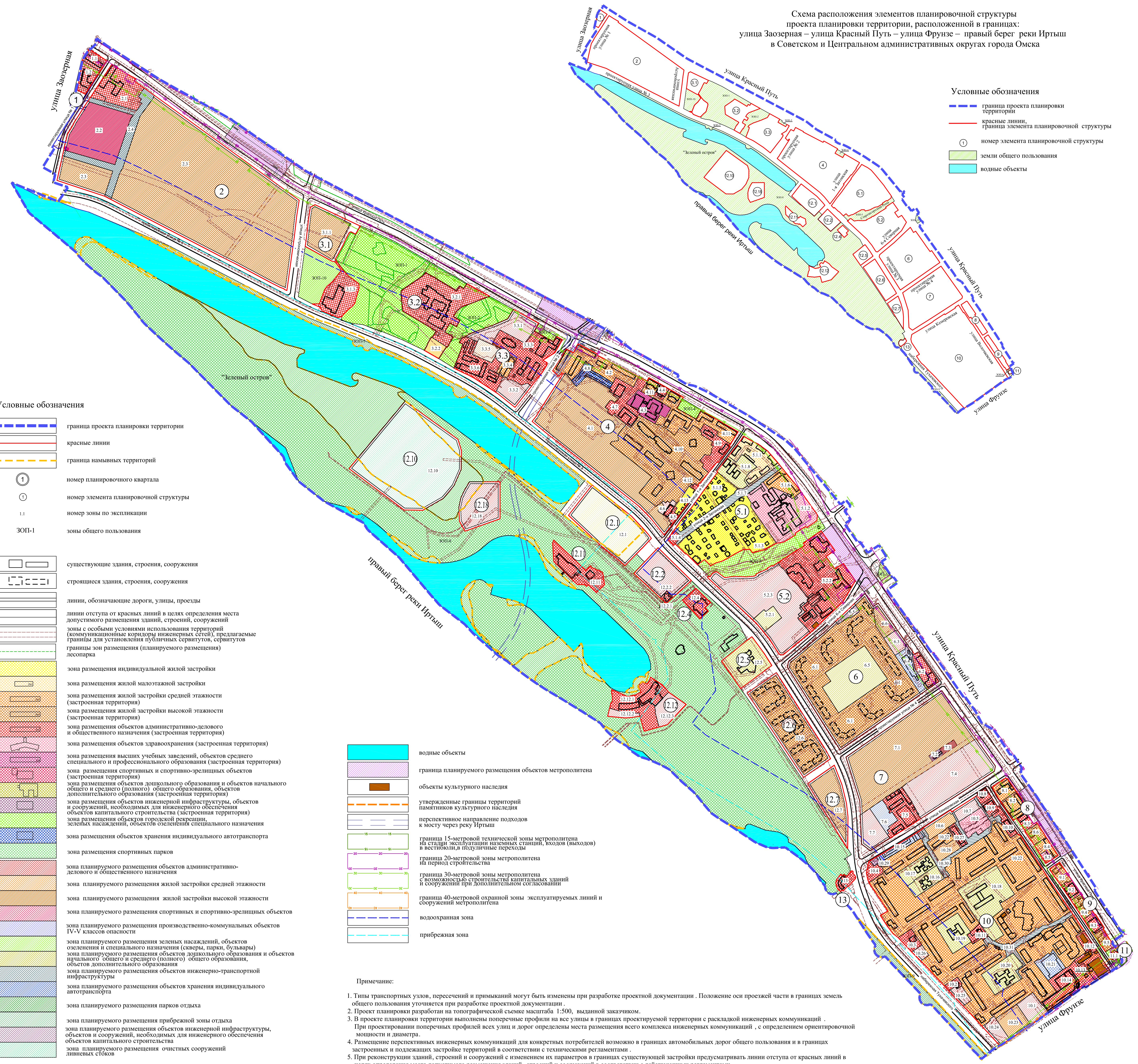
Схема расположения элементов планировочной структуры проекта планировки территории, расположенной в границах: улица Заозерная – улица Красный Путь – улица Фрунзе – правый берег реки Иртыш в Советском и Центральном административных округах города Омска

Условные обозначения граница проекта планировки территории красные линии граница намываемых территорий 1 номер элемента планировочной структуры земли общего пользования водные объекты