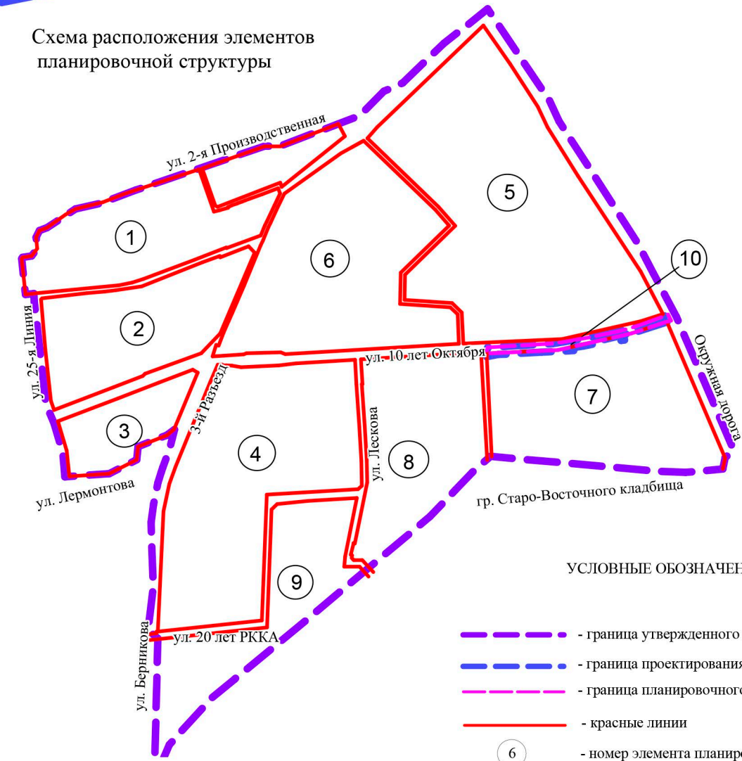
Схема расположения элементов планировочной структуры