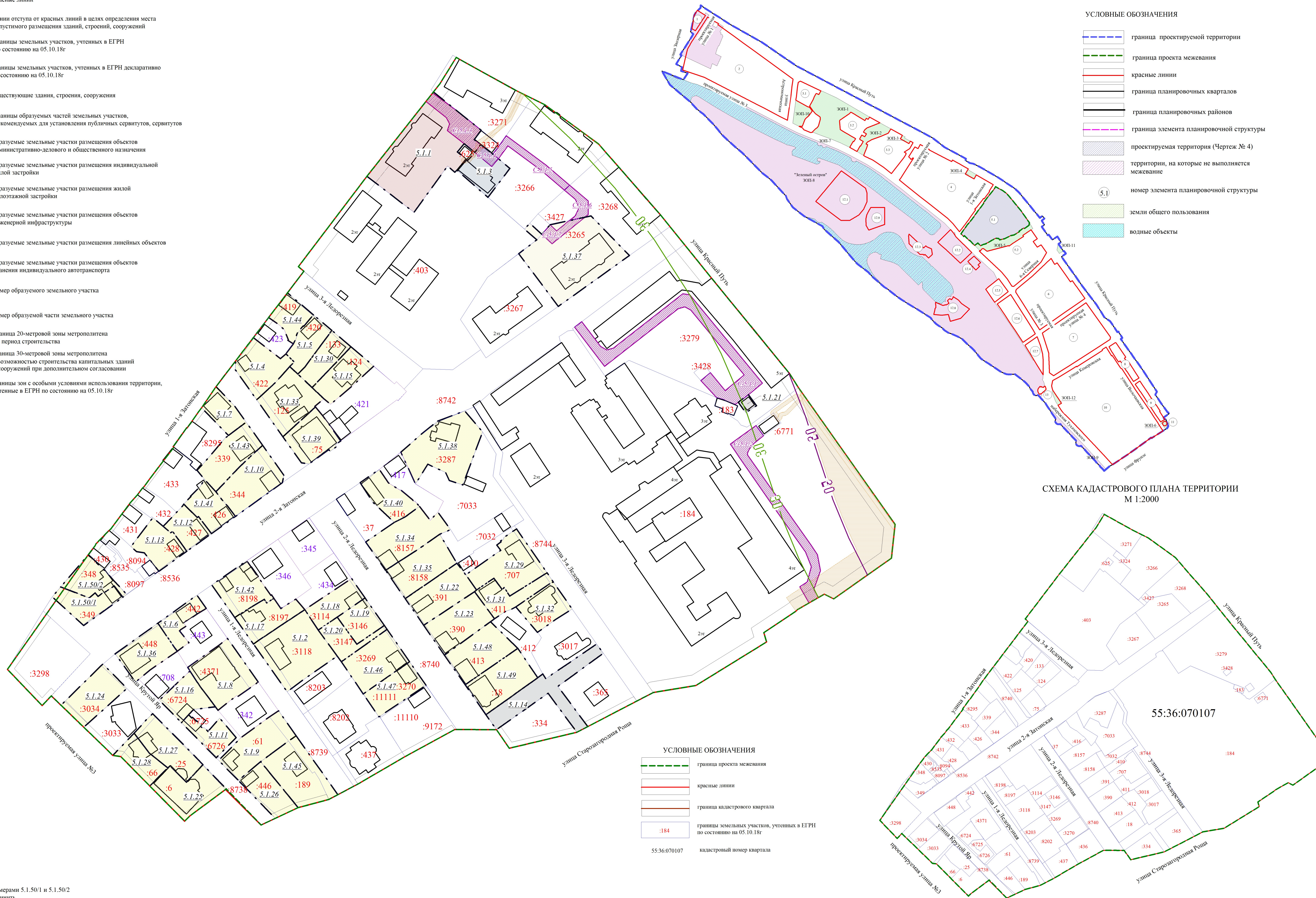
СХЕМА КАДАСТРОВОГО ПЛАНА ТЕРРИТОРИИ М 1:2000