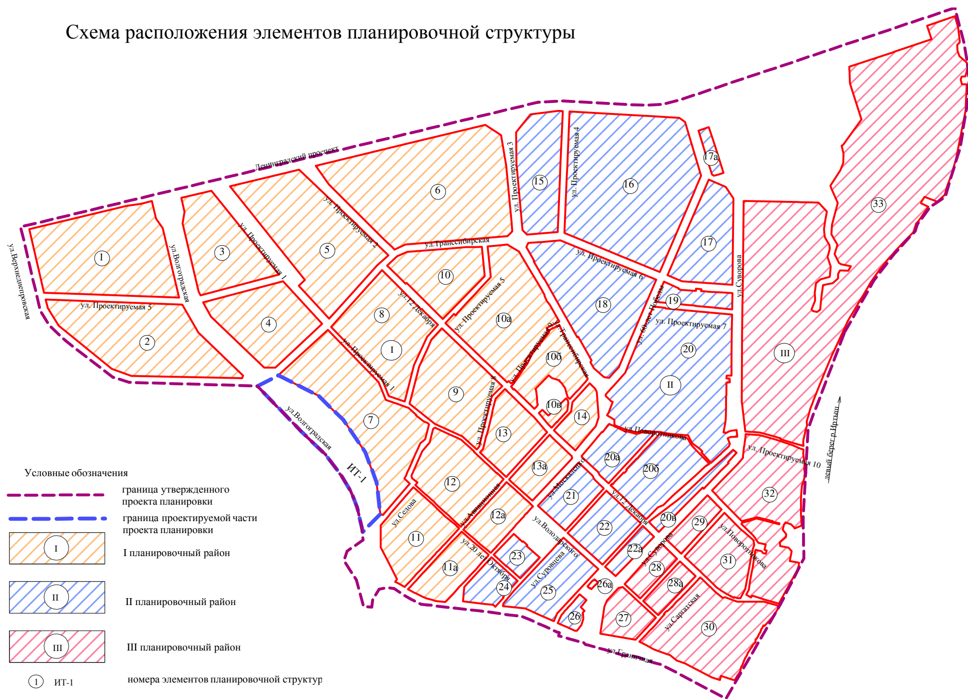
Схема расположения элементов планировочной структуры